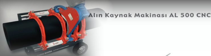
Alin Kaynak Makinası AL 500 CNC