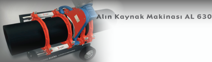
Alin Kaynak Makinası AL 630